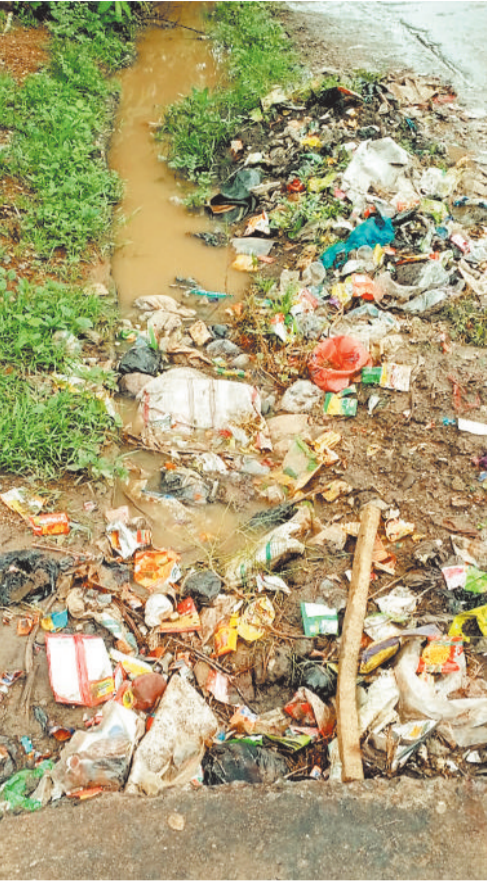
अटल आवास वार्ड नंबर 3 उसलापुर में कचरे का साम्राज्य।