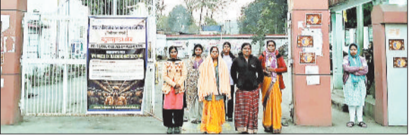
तालाबंदी कर धरना प्रदर्शन करती भूविस्थापित महिलाएं।