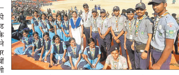
अधिक प्रतिभागी सम्मिलित हुए। भारत स्काउट्स एवं गाइड्स के राज्य

भारत स्काउट्स एवं गाइड्स की 19वीं राष्ट्रीय जम्बूरी तथा डायमंड जुबली ग्रैंड फिनाले में कोरबा स्काउट्स, गाइड्स, रोवर्स, रेंजर्स ने भागीदारी की। 23 से 29 नवम्बर तक लखनऊ तथा प्रदेश में 19वीं राष्ट्रीय जम्बूरी उच्च आयमंड जुबली जम्बूरी का भव्य आयोजन हुआ। इसमें देश- विदेश से 35 हजार से