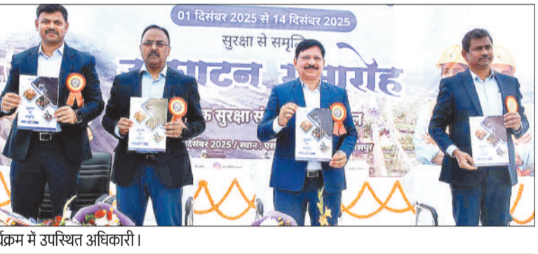
कार्यक्रम में उपस्थित अधिकारी।