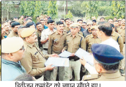
डिवीजन कमांडेंट को ज्ञापन सौंपते हुए।