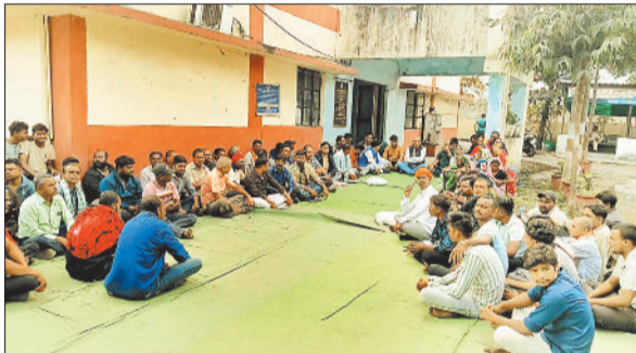
हरदीबाजार थाने का घेराव करते ग्रामीण।

का सर्वे किया जा रहा था। थाने के छत का इस्तेमाल कर ड्रोन सर्वे करने की जानकारी मिलते ही ग्रामीणों में हड़कंप मच गया और आक्रोशित ग्रामीणों ने थाना का