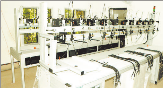
तिफरा बिजली कार्यालय में बनाया गया टेस्टिंग लैब।

स्मार्ट मीटर में अधिक रीडिंग की शिकायत के बाद प्रदेश में मीटर टेस्टिंग लैब की स्थापना की जा रही है। प्रदेश में बिजली उपभोक्ताओं को बेहतर सुविधा देने और स्मार्ट मीटरों की जांच प्रक्रिया को तेज करने के लिए बड़े कदम उठाए गए हैं। स्मार्ट मीटर की बढ़ती संख्या को देखते हुए रायपुर और बिलासपुर में दो नए अत्याधुनिक लैब बनाए गए हैं। बिलासपुर