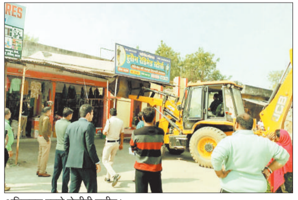
अतिक्रमण हटाने जैसीवी मशीन।

यू बस स्टैंड, अम्बिकापुर मार्ग, बिलासपुर मार्ग और कोरबा मार्ग इन चार मुख्य स्थानों पर अतिक्रमण लगातार बढ़ रहा था। दुकानदारों ने अपनी दुकानों के बाहर शेड लगाकर सामान सजाना शुरू कर दिया था, जिससे सड़क की चौड़ाई कम हो रही थी और आए दिन जाम की स्थिति बन रही थी। प्रशासन की टीम ने इन सभी जगहों पर बने अवैध ढांचों को तोड़कर रास्ता साफ