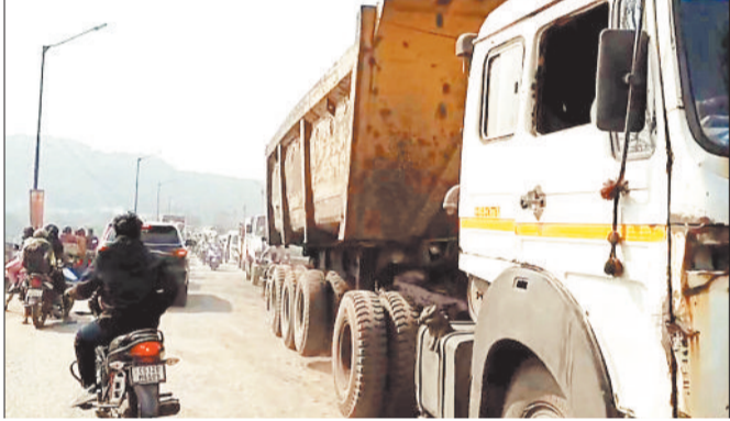
बालको और राताखार मार्ग से गुजरते भारी वाहन।