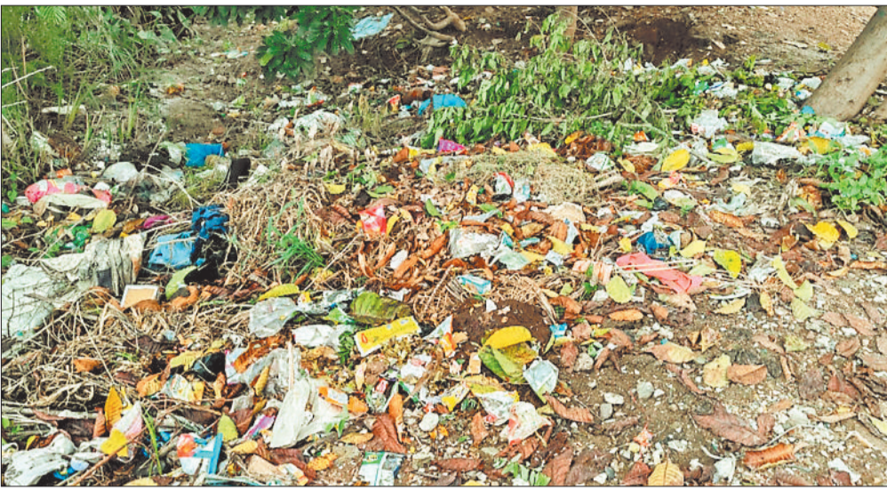
वार्ड नंबर 14 बंधवापारा में गंदगी का आलम।

वर्ष 2019 से पहले राज्य शासन ने नगर निगम में तिफरा नगर पालिका परिषद, सकरी व सिरगिट्टी नगर पंचायत समेत 15 ग्राम पंचायतों को शामिल किया था। अब यहां के निवासियों के अनुसार, वार्डों में अब तक सड़क निर्माण, नाली व्यवस्था, नियमित कचरा संग्रहण और स्ट्रीट लाइट जैसी मूलभूत सुविधाओं का गंभीर अभाव बना हुआ है। कई जगहों पर गलियों की हालत जर्जर है और बारिश के दौरान पानी भर जाने जैसी समस्याएँ आम हैं। लोगों ने बताया कि शिकायतें दर्ज कराने के बावजूद संबंधित विभागों की ओर से कोई ठोस कार्रवाई नहीं की जाती।