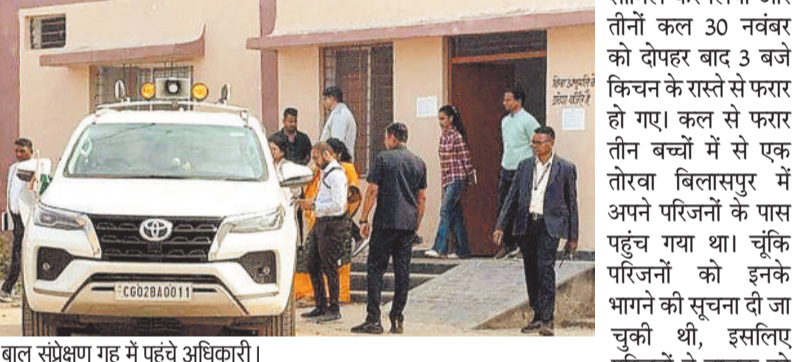
बाल संप्रेक्षण गृह में पहुंचे अधिकारी।