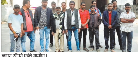
ज्ञापन सौंपने पहुंचे ग्रामीण।