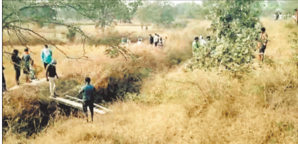
घटनास्थल पर जांच करती

एक 40 से 45 वर्षीय युवक की बेरहमी से हत्या की गई है। हत्यारों ने उसके चारों हाथ पैर के उंगलियों को काटने के बाद उसके गुण्ठांग को भी काट दिया है और उसकी पहचान छुपाने के लिए लाश को जला दिया